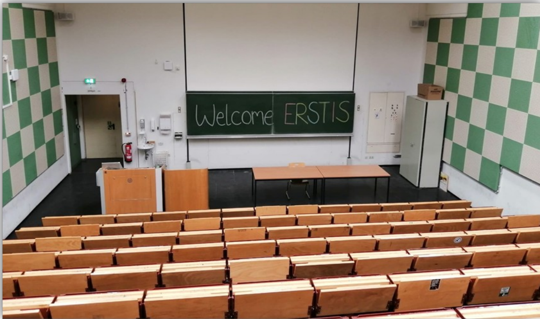
Hörsaal 14 in der Uni Bielefeld, Stuhlreihen mit Blick auf die Tafeln auf denen steht „Welcome Erstis“